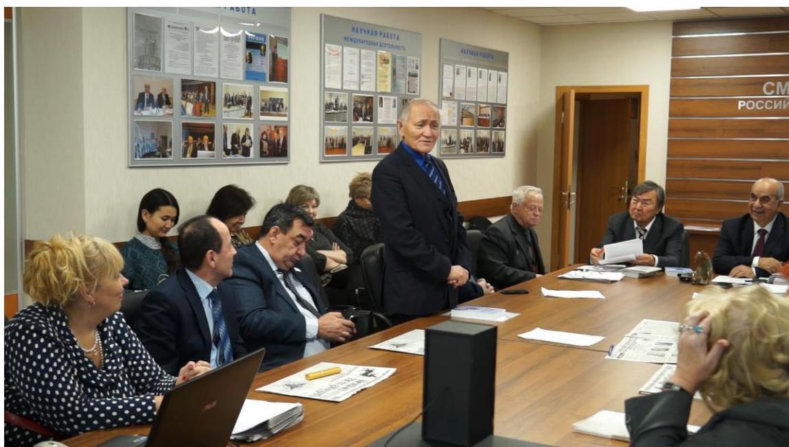
Олжас Сулейменов во главе стола (слева от него Г.М. Иманов, справа А.И. Субетто)

Александра Ивановича Субетто с Олжасом Омаровичем я познакомил на Всемирном форуме духовной культуры (Казахстан, Астана, 18 – 20 октября 2010 года). Известный на Востоке и в Европе дипломат Представитель ЮНЕСКО в Казахстане был одним из инициаторов собрания моральных и духовных лидеров планеты (более 1000 человек из 70 стран). Президент Ноосферной общественной академии наук выступил с докладом на секции «Глобальная стратегическая инициатива мирового гражданского сообщества: Ноосферная этико-экологическая конституция Человечества» , организованной Любовью Сергеевной Гординой, автором проекта Ноо-Конституции Человечества (2007 г.), организатором и лидером Ноосферной духовно-экологической ассамблеи мира.